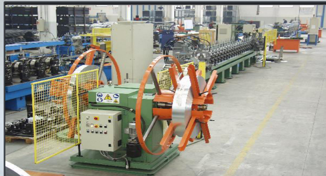
Visuale di insieme linea