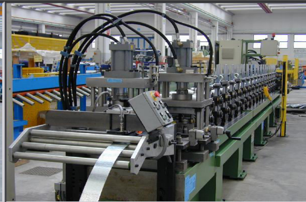
Unità di punzonatura