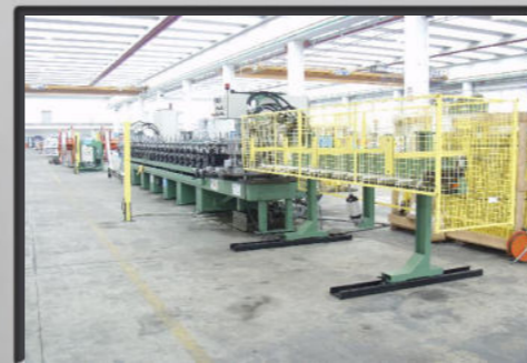
Banco di scarico